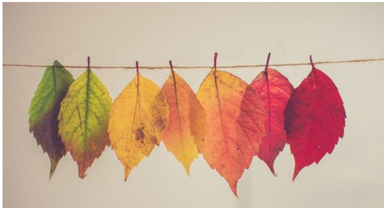
Team "De Horizon" * * * *

Inmiddels is het alweer een maand geleden dat we de maand oktober feestelijk gestart zijn. Nu ligt de 'Grote Avond' en de Herfstvakantie alweer achter ons. De klok is verzet, de wintertijd breekt weer aan en voor we het weten is Sinterklaas weer in het land. In deze 'info De Horizon' kunt u de planning voor de komende maand weer lezen. We hopen dat u dat met veel interesse zal doen.