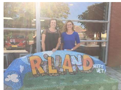
IKC Team De Horizon

Deze werkgroep heeft al grote stappen gemaakt met het herinrichten van de magazijnen. Nu er een akkoord is voor de verbouwing, kunnen we het plan van aanpak maken. De verbouwing zal in de zomervakantie plaatsvinden. U zult begrijpen dat daarvoor de lokalen moeten worden leeggeruimd en verhuisd. Hoe beide organisaties dit aanpakken en wat dat betekent, zal de komende weken duidelijk worden.